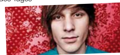
„ICH BIN DABEI - UND DU? WIR SEHEN UNS!“